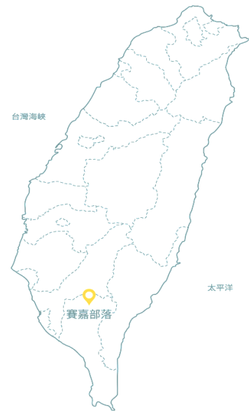
▲圖二 展覽內部落位置示意圖

賽嘉部落為魯凱族與排灣族共組而成，位於屏東縣三地門鄉賽嘉村。根據民國 114 年統計之〈原住民族委員會核定並刊登公報之部落一覽表〉，賽嘉村共 251 戶 833 人。族人原生活於霧臺部落，於昭和 14 年(1939 年)遷至現址，今部落位置緊鄰潮州斷層，位於口社溪與隘寮溪沖積平原與中央山脈的交界處。