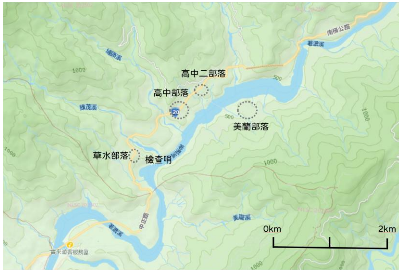
▲圖六 高雄市桃源區高中里鄰近區域等高線地形圖