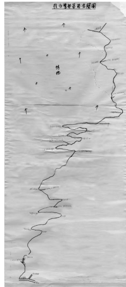
▲圖四 展覽內部往白鷺部落路況簡圖