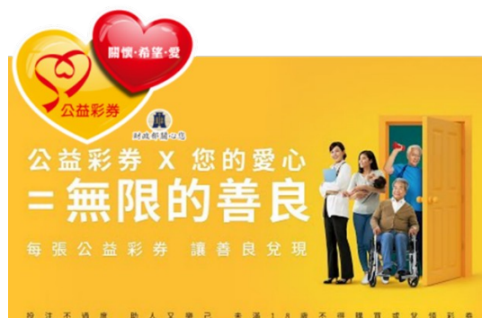
▲ 公益彩券廣告 (2024 年)