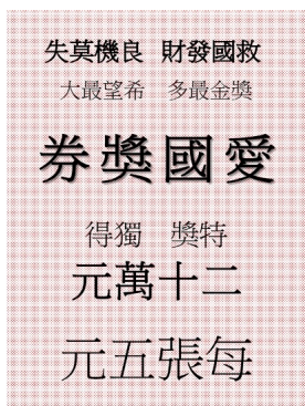
▲ 愛國獎券宣傳海報 (文字由右至左閱讀)